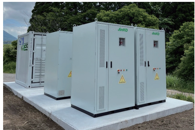
图2. 晶科储能215KWh直流柜

SunGiga直流系统采用磷酸铁锂电池，配备液冷系统和气溶胶防火装置，设计符合日本消防法要求，并搭载晶科储能云平台。